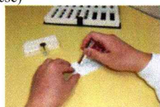
3. キャップを開け、ニオイ部分を出す (3~5mm程度)