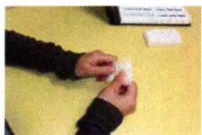
4. 薬包紙に塗りつけ(直径2cmの円を5周くらい)、 塗った側を内側にして半分に折り、被検者に渡す