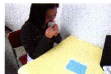
5. 選択肢カードを前において、選択肢を見ながら 薬包紙を鼻に近づけ、開いてニオイを嗅ぐ