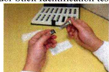
2. 検査者はスティックを1本取り出す