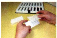
1. 薬包紙を1枚取り出し、台紙に重ねる

(Odor Stick Identification test for Japanese)